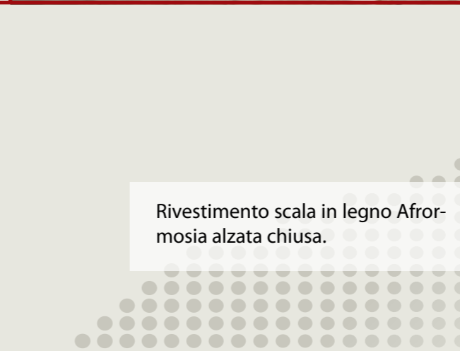
Rivestimento scala in legno Afrormosia alzata chiusa.