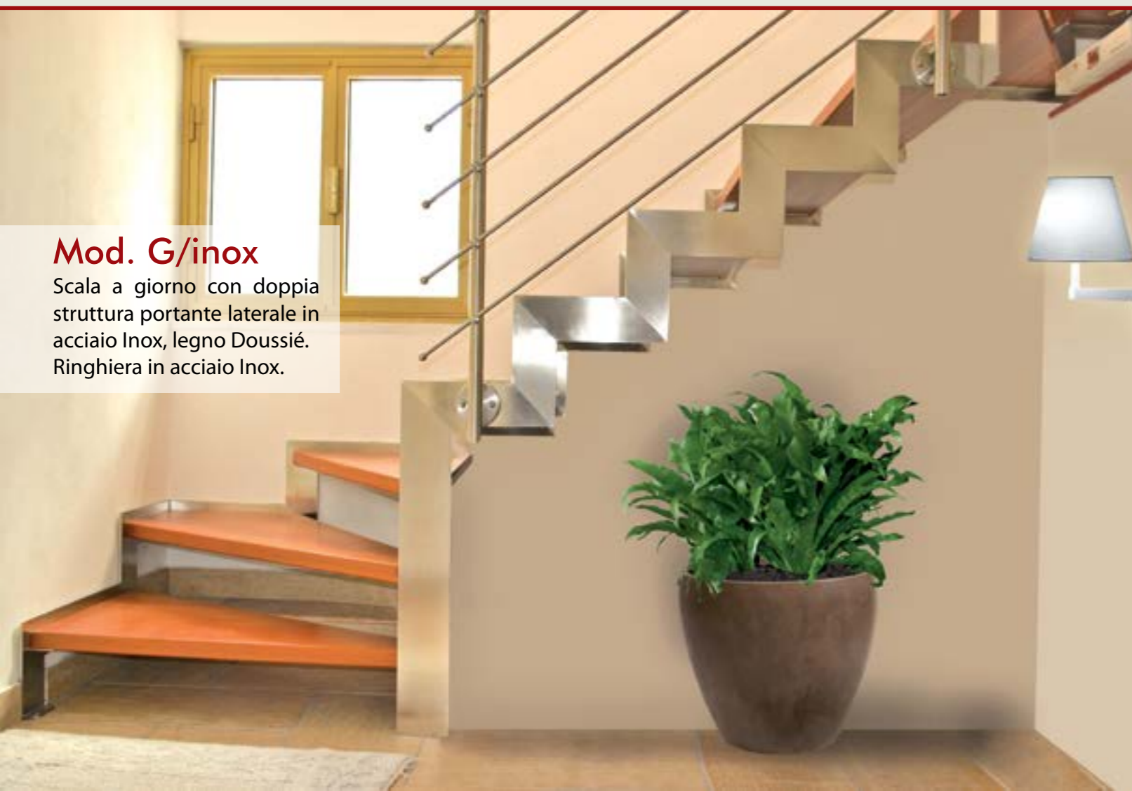
Mod. G/inox Scala a giorno con doppia struttura portante laterale in acciaio Inox, legno Doussiè. Ringhiera in acciaio Inox.