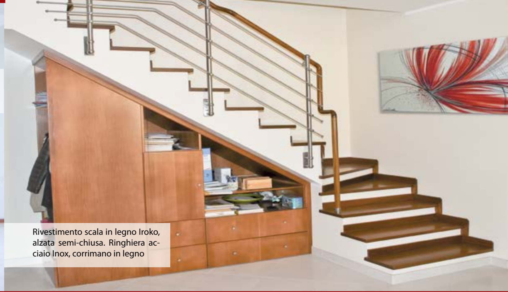
Rivestimento scala in legno Iroko, alzata semi-chiusa. Ringhiera acciaio Inox, corrimano in legno