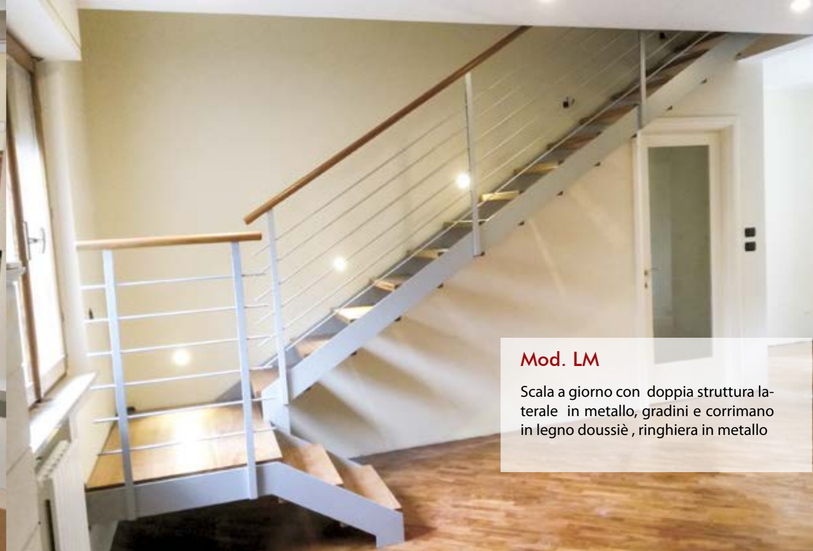
Mod. LM Scala a giorno con doppia struttura laterale in metallo, gradini e corrimano in legno doussiè , ringhiera in metallo