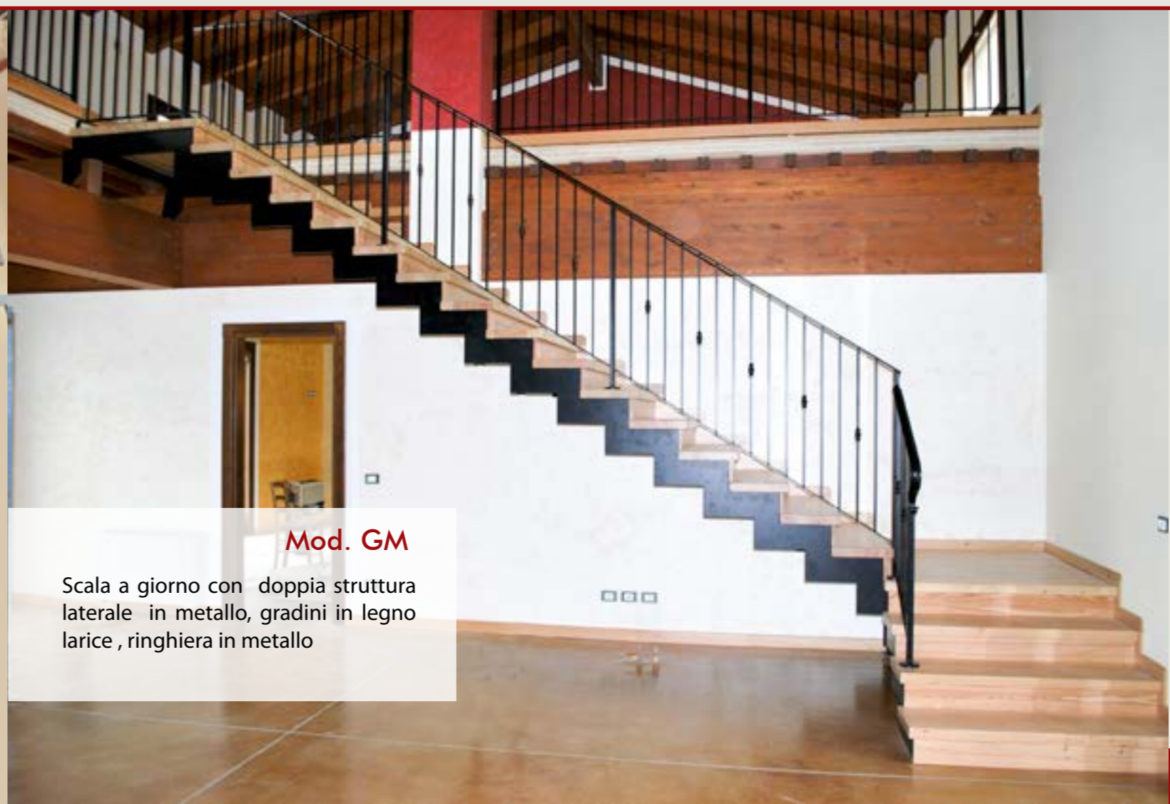
Mod. GM Scala a giorno con doppia struttura laterale in metallo, gradini in legno larice , ringhiera in metallo