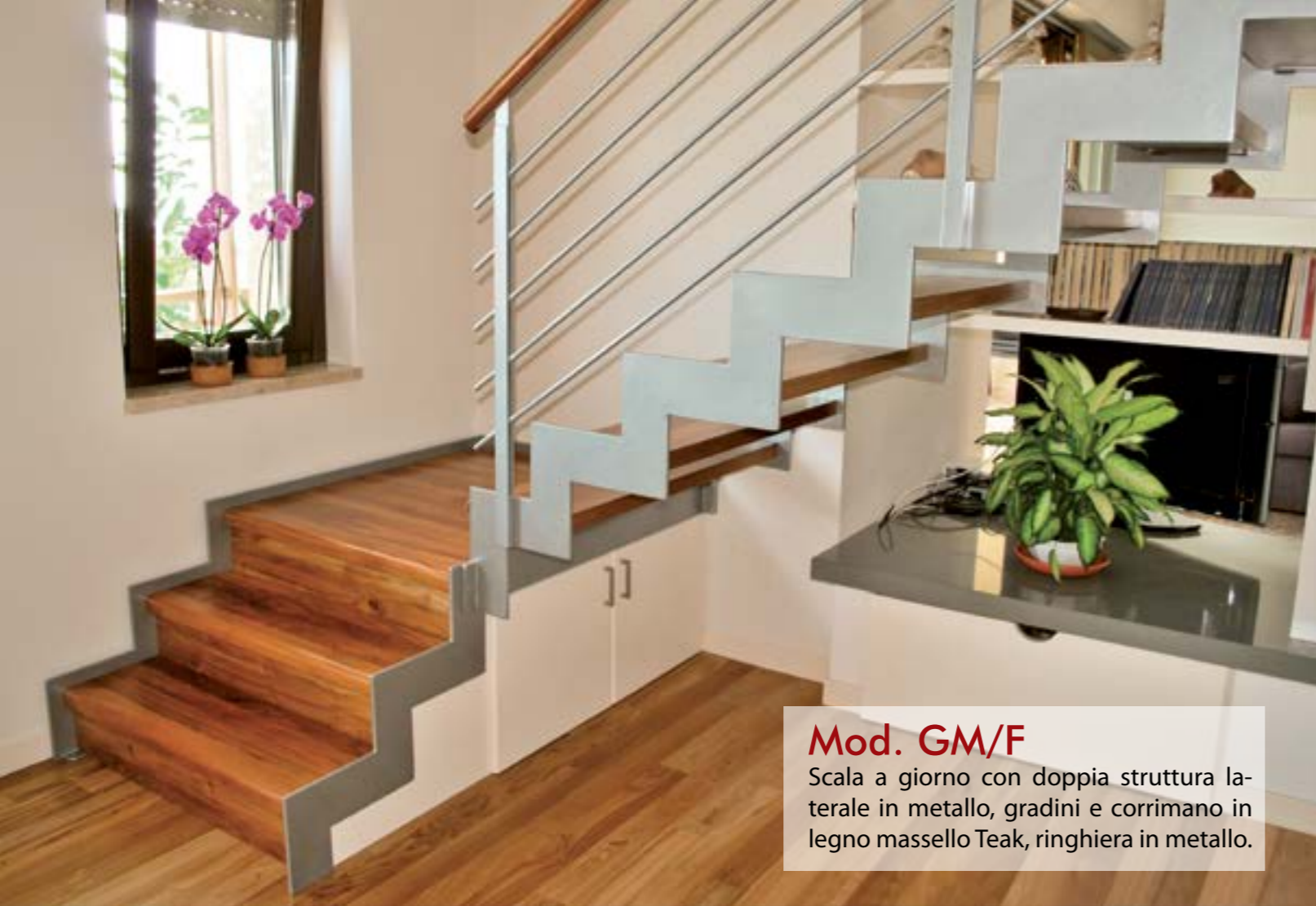
Mod. GM/F Scala a giorno con doppia struttura laterale in metallo, gradini e corrimano in legno massello Teak, ringhiera in metallo.