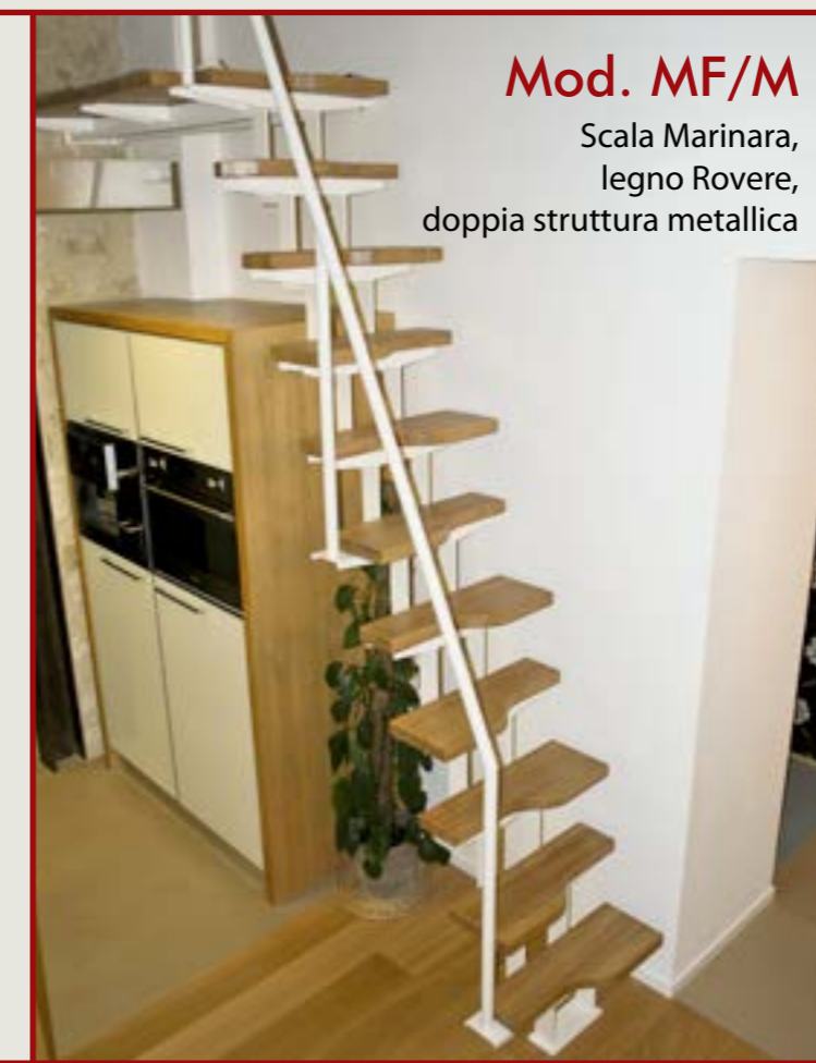
Mod. MF/M Scala Marinara, legno Rovere, doppia struttura metallica