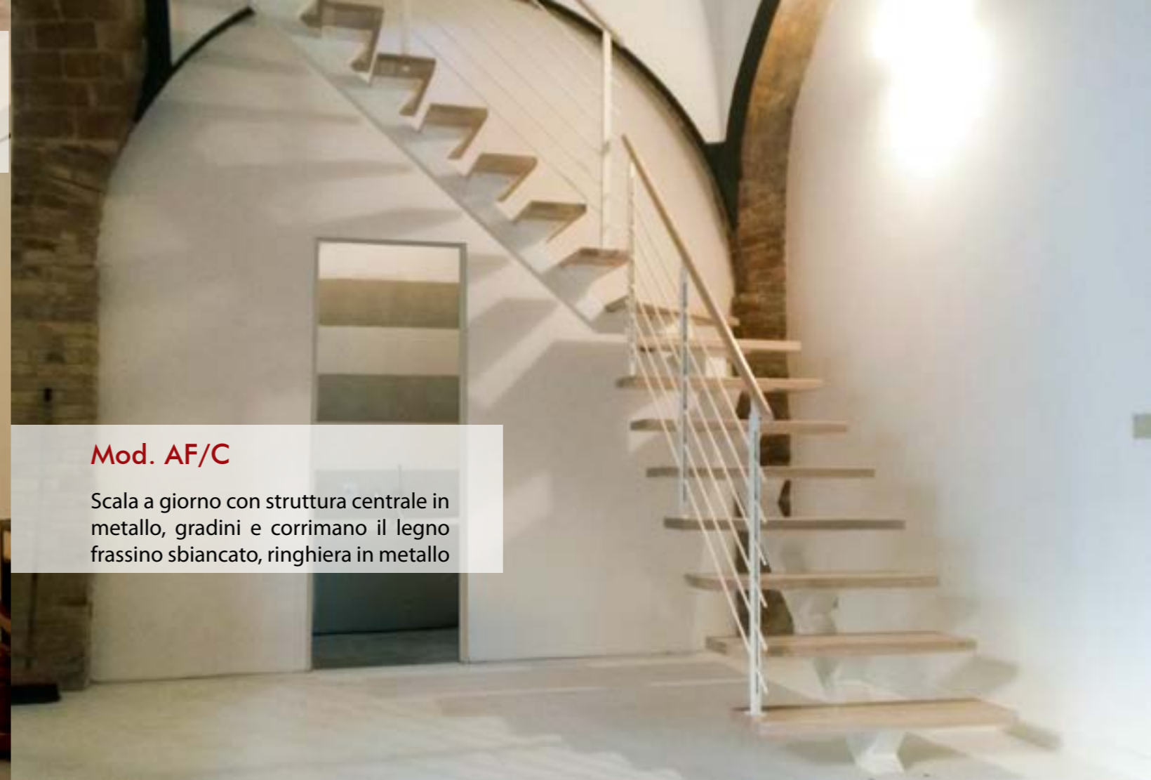
Mod. AF/C Scala a giorno con struttura centrale in metallo, gradini e corrimano il legno frassino sbiancato, ringhiera in metallo