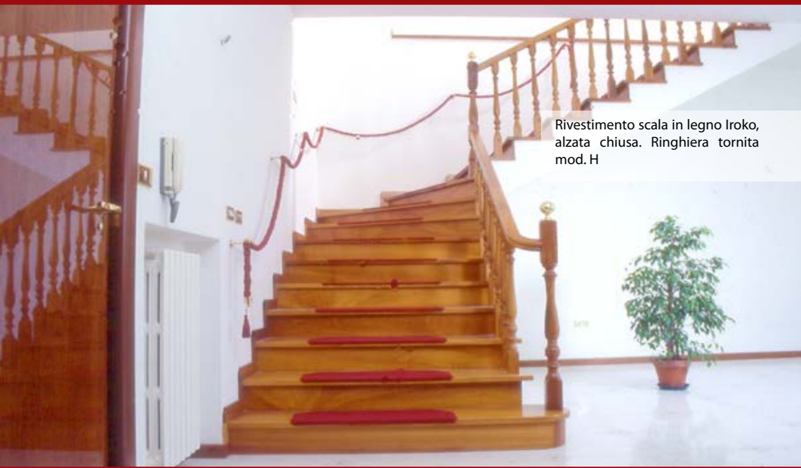
Rivestimento scala in legno Iroko, alzata chiusa. Ringhiera tornita mod. H