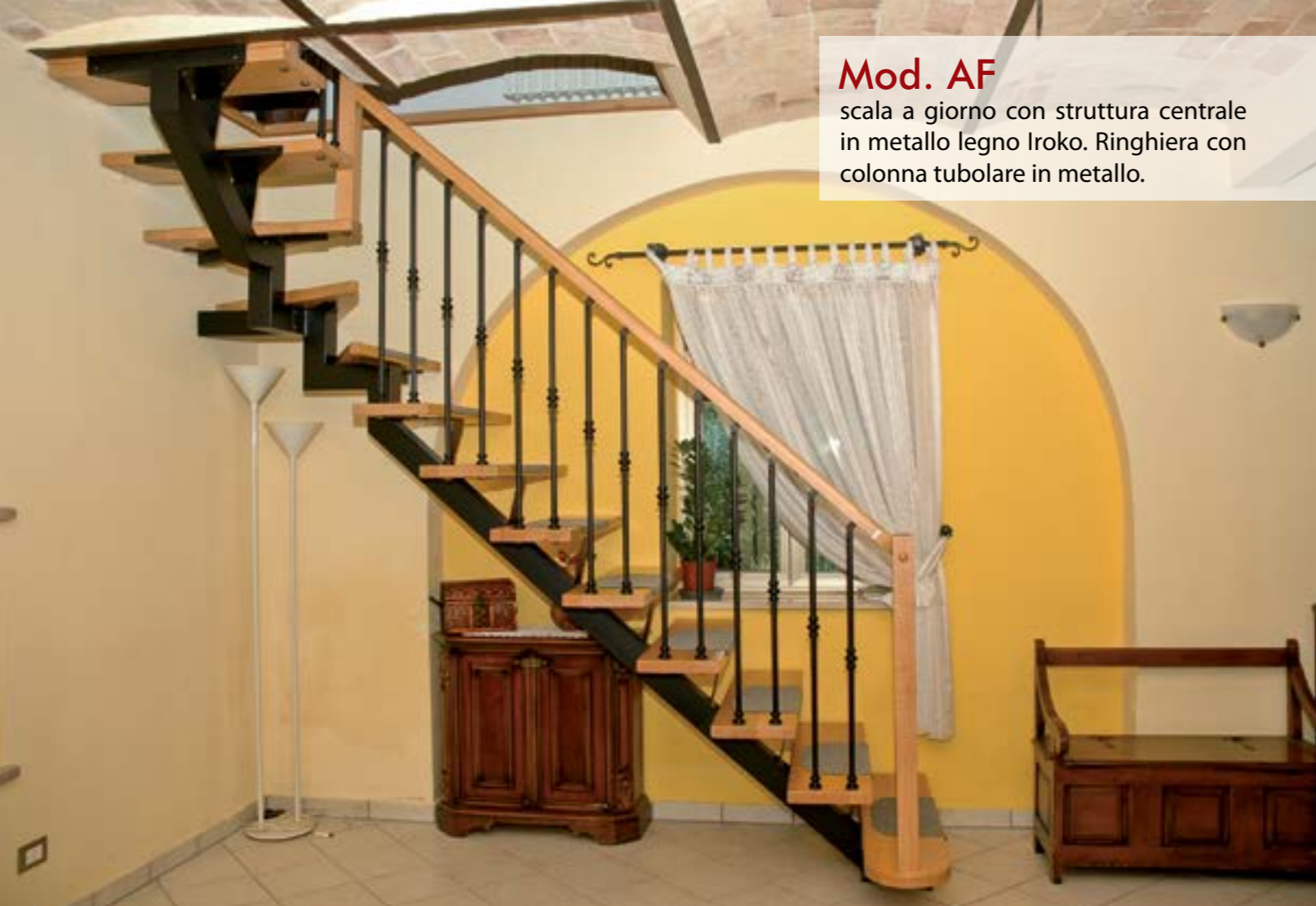
Mod. AF scala a giorno con struttura centrale in metallo legno Iroko. Ringhiera con colonna tubolare in metallo.