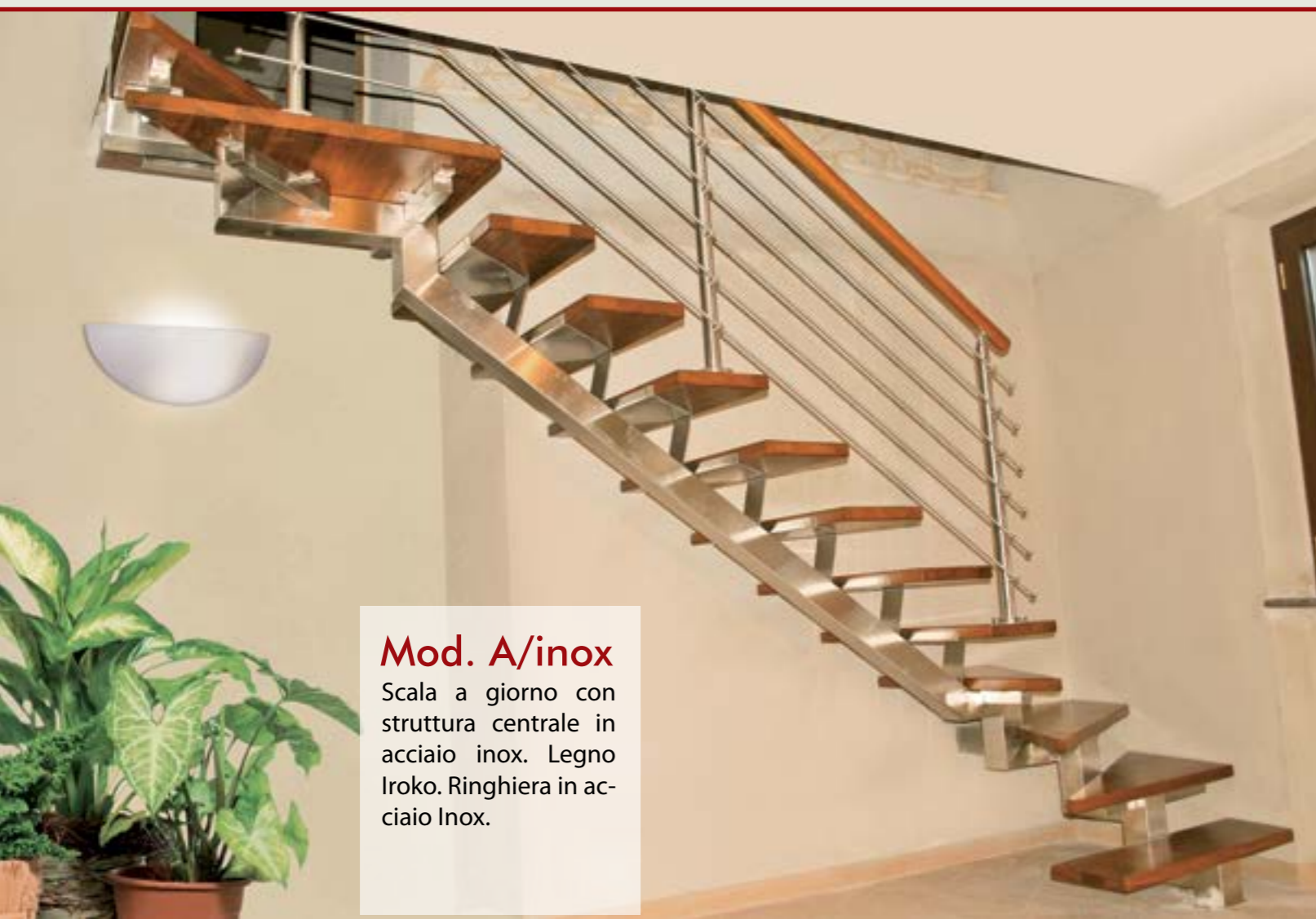
Mod. A/inox Scala a giorno con struttura centrale in acciaio inox. Legno Iroko. Ringhiera in acciaio Inox.